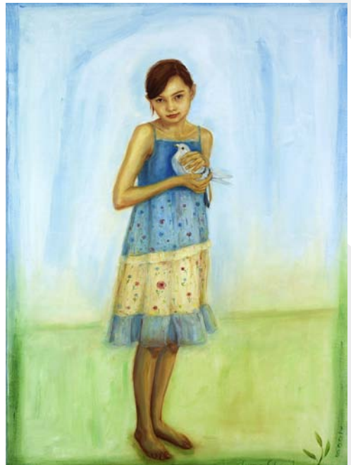
Zwei Bilder aus dem «Vaterunser»-Zyklus, den Irma Streck in Zofingen ausstellen wird: «Wie im Himmel, so auf Erden» und «Unser tägliches Brot gib uns heute.»